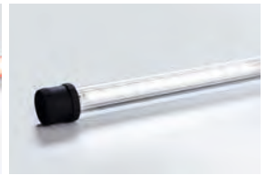
Luminaria tubular LED de color azul